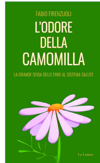
L'odore della camomilla La grande sfida delle erbe al Sistema Salute Fabio Firenzuoli Le Lettere, 2025

e divulgazione scientifica ed è autore di numerosi testi dedicati alle piante medicinali, alla fitoterapia e alle interazioni delle piante con alimenti e farmaci.