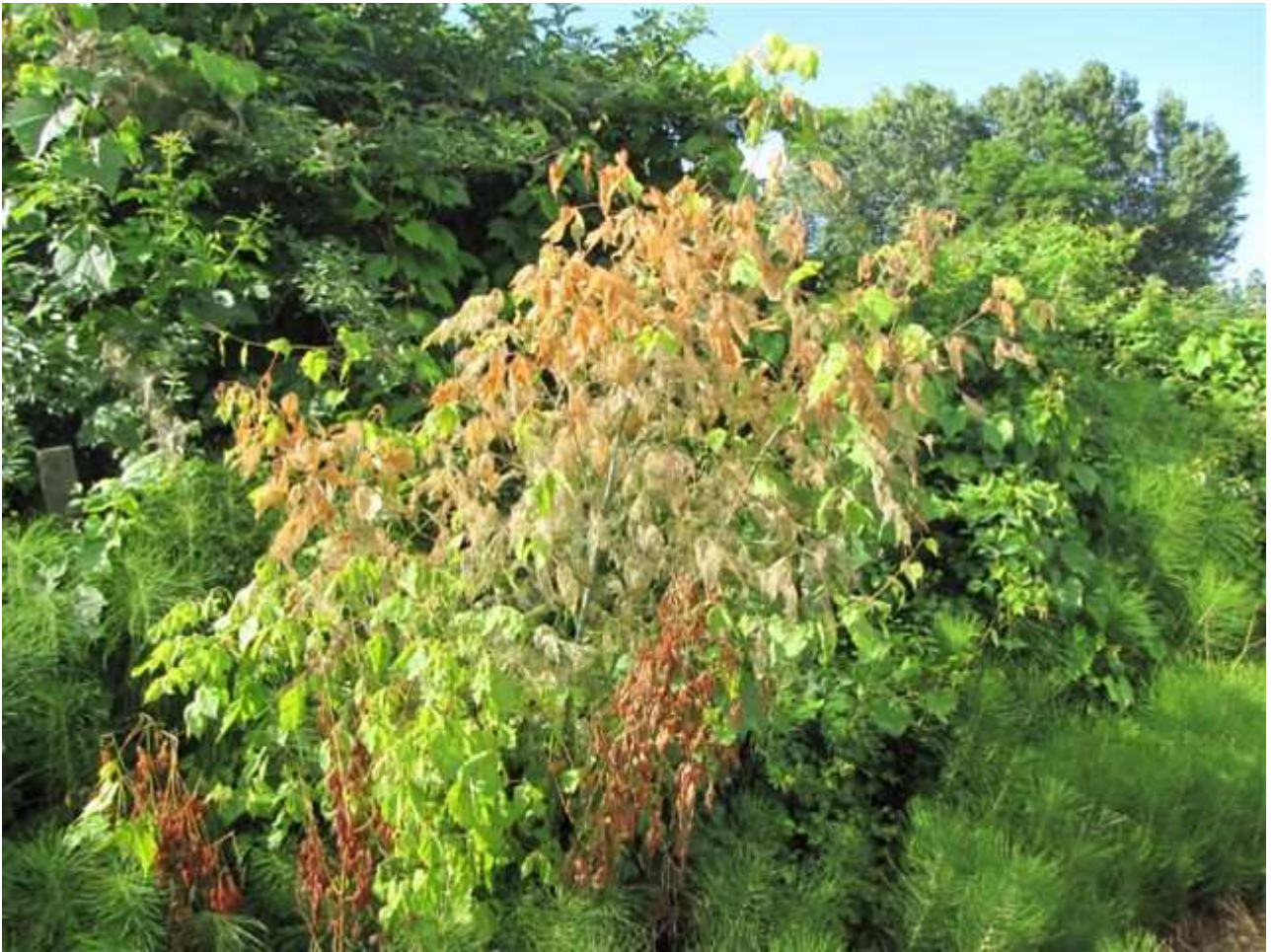
Intenso attacco di Hyphantria cunea