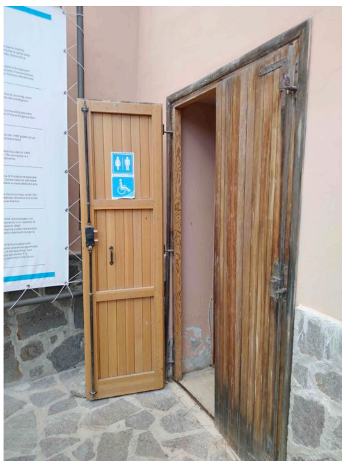
Vista della porta di accesso al disimpegno del bagno, si noti il gradino a terra di 3cm e la larghezza della singola anta <80cm.