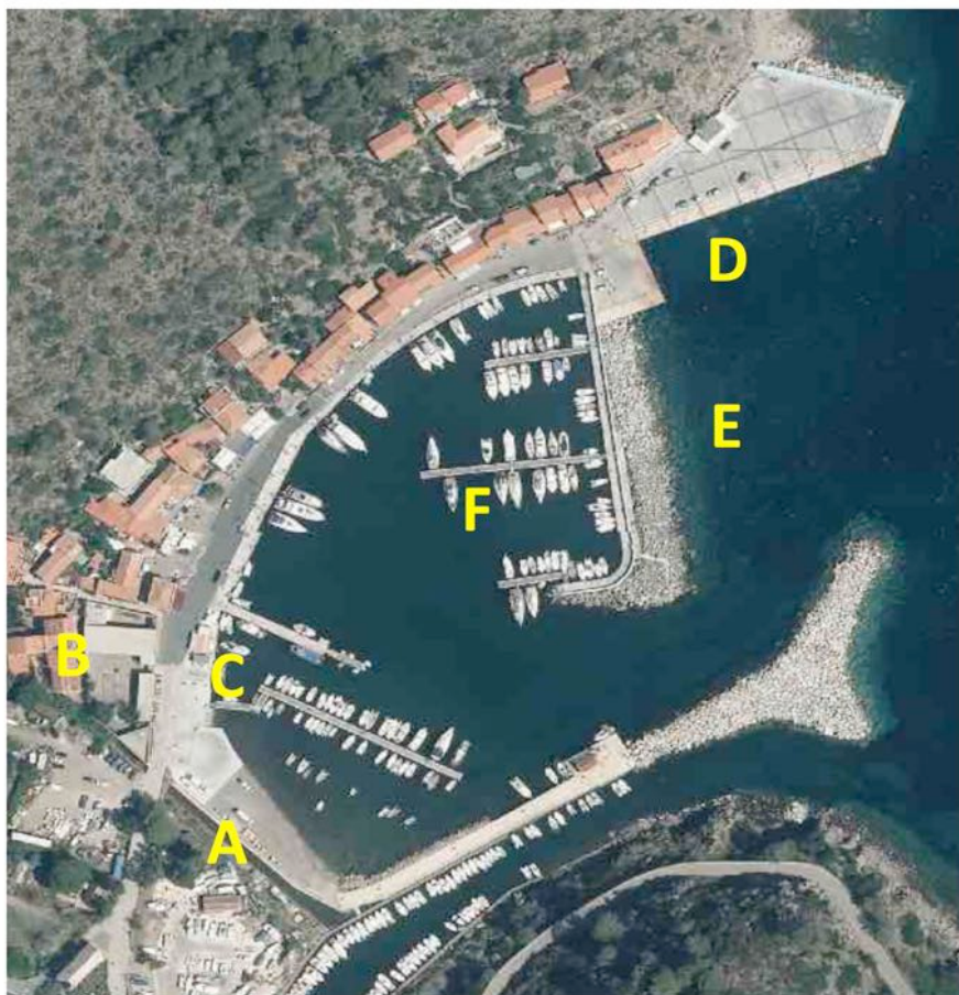
Vista aerea del Porto Isola di Capraia (LI)

(localizzare, per quanto possibile, le criticità rilevate e specificare se ricorrenti)