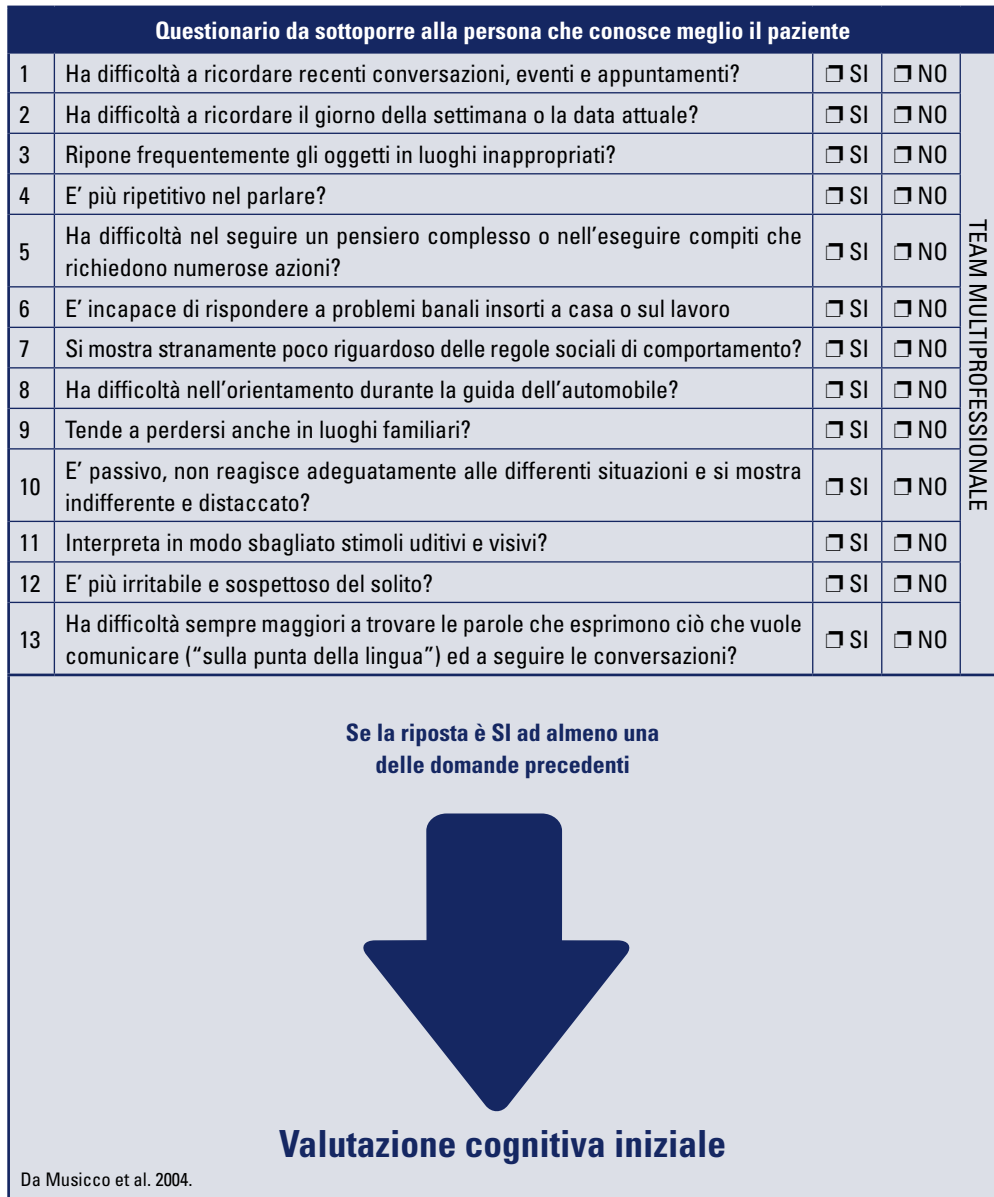
Figura 1. Intervista diagnostica per demenza

Per la valutazione cognitiva iniziale è utile la somministrazione del Mini-Cog Test (Borson 2000), che consente di verificare la memoria a lungo e a breve termine, la capacità di rappresentazione visiva e spaziale, la capacità di attenzione e le funzioni esecutive.