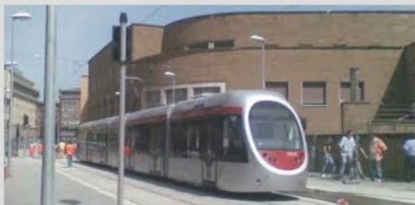
TRASPORTO PUBBLICO LOCALE

Direzione Mobilità, Infrastrutture e Trasporto Pubblico Locale