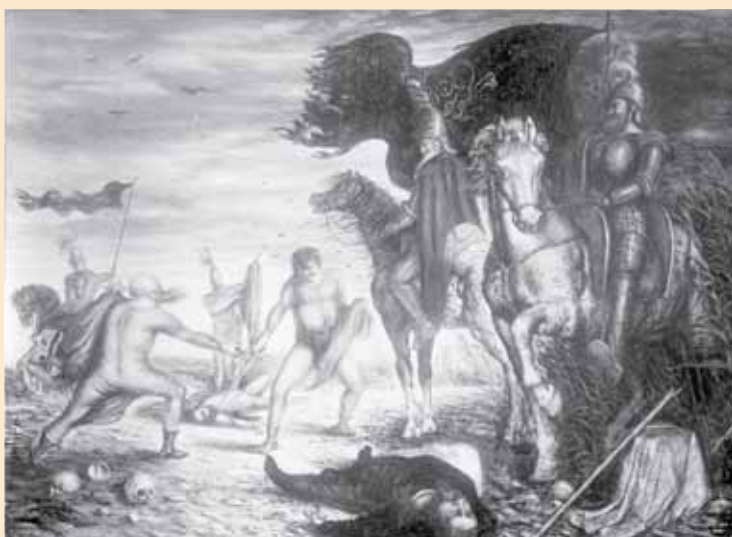
G. De Chirico, Duelli a Morte, primi mesi del 1924, già raccolta Castelfranco

Siviero era sicuramente informato della alienazione delle opere dell'amico, infatti nella sua biblioteca si trova il Bollettino n. 71 della Galleria del Milione, dedicato alla mostra del marzo 1941.