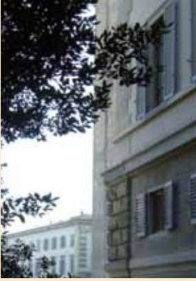
Piazza Poggi vista dalla finestra della camera con il letto a baldacchino di Casa Siviero