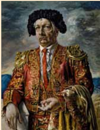
G. De Chirico, Autoritratto in costume da torero , 1941-2, museo Casa Siviero (n. inv. 59c)

Frontespizio di una copia del romanzo Ebdòmero di Giorgio De Chirico, corretta a mano dall'autore nel luglio 1943, Biblioteca di Casa Siviero (n. inv. 203lm ter)