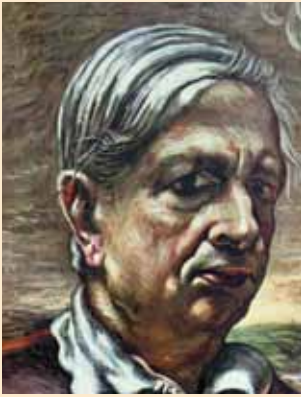
Fotografia di un autoritratto di De Chirico con dedica del pittore a Rodolfo Siviero del 15 febbraio 1950, museo Casa Siviero (n. inv. 15); in basso particolare della dedica

È a Roma, quindi, che nell'immediato dopoguerra si ritrovano i tre protagonisti della nostra storia. Nell'aprile del 1946 Siviero è incaricato di dirigere l'ufficio interministeriale per il recupero delle opere d'arte trafugate durante la guerra 83 . A questo lavoro collabora Castelfranco, che nel 1947 si reca con Siviero in Germania per trattare la restituzione di quanto trafugato dopo l'8 settembre 84 . E' proprio Castelfranco a firmare il catalogo della mostra aperta alla Villa Farnesina di Roma nel novembre del 1947, dove vengono presentate le opere, in gran parte dei musei napoletani, di cui Siviero aveva ottenuto la restituzione 85 . Il perdurare dei rapporti di amicizia tra Siviero e De Chirico in questo tempo è documentato da un'altra foto con dedica conservata nella casa-museo. 86