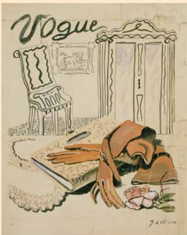
G. De Chirico, bozzetto preparatorio per copertina di Vogue , 1935, museo Casa Siviero (n. inv. 56c)

Fino al periodo della guerra Siviero ebbe poche occasioni di coltivare le sue relazioni con De Chirico 52 . Tra il 1940 e il 1943, invece, il pittore soggiorna spesso a Firenze 53 . Il primo documento che abbiamo reperito relativo a rapporti tra De Chirico e Siviero è la amichevole dedica che, nel luglio 1940, il pittore appone sul Ritratto di fanciulla con mela 54 . Alla fine di quell'anno la confidenza tra i due doveva essere già notevole. A novembre infatti De Chirico scrive una cartolina a Siviero con la quale gli chiede di procurargli un libro su Dürer. Siviero, che certamente non era persona timida, ne approfitta per domandargli una decina di disegni per illustrare un suo libro, fornendo anche indicazioni precise sui soggetti 55 . Molti anni più tardi ricorderà di avere poi deciso di non farne niente per paura che il pittore gli chiedesse una cifra che non aveva a disposizione 56 . Le lodi che, nella sua lettera, Siviero riservava alla grandezza della fantasia, alla finezza della poesia, della composizione e dell'esecuzione di De Chirico non erano false piaggerie. Egli ammirava sinceramente De Chirico come uno dei grandi geni dell'arte moderna. Il libro per il quale chiedeva i disegni al pittore è quasi sicuramente un saggio critico, mai terminato, ma più volte citato