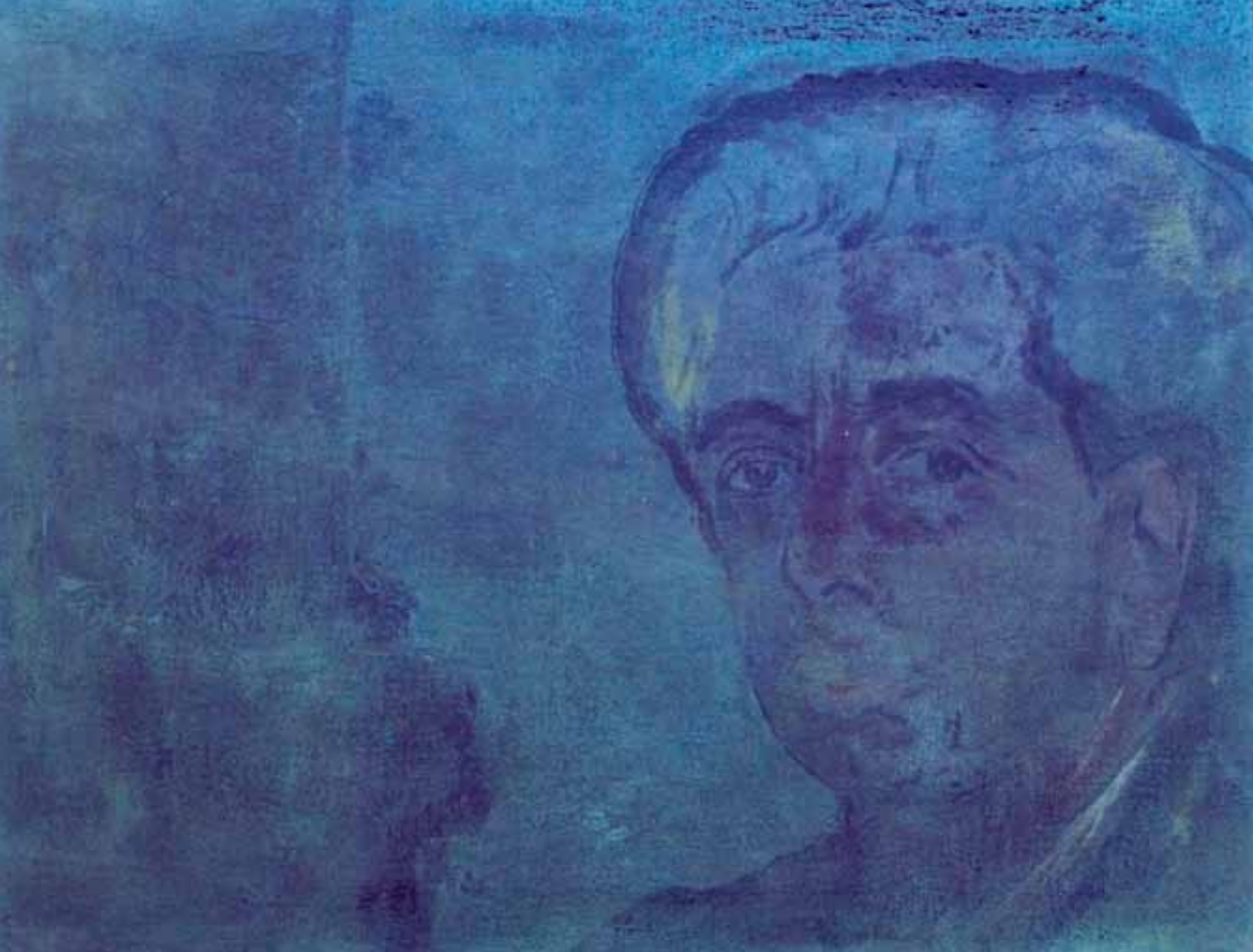
Foto ad infrarosso dell'autoritratto con colonna prima del restauro.

La foto ad infrarosso evidenzia vecchi ritocchi. Ad una attenta analisi dell'immagine si nota, infatti, che la colonna architettonica sulla sinistra del dipinto presentava un offuscato e più spesso strato di vernice ossidata che interessa tutta la superficie pittorica e vari ritocchi sul bordo inferiore destro del basamento della stessa, chiaramente eseguiti su un preesistente strato di vernice originale.