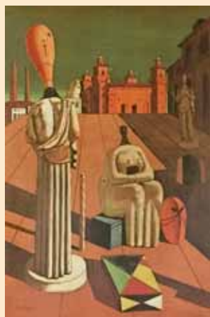
G. De Chirico, Le Muse Inquietanti , 1916-8, già raccolta Castelfranco