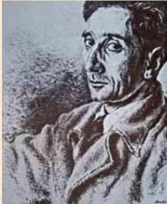
A. Savinio, Ritratto di Giorgio Castelfranco , 1931