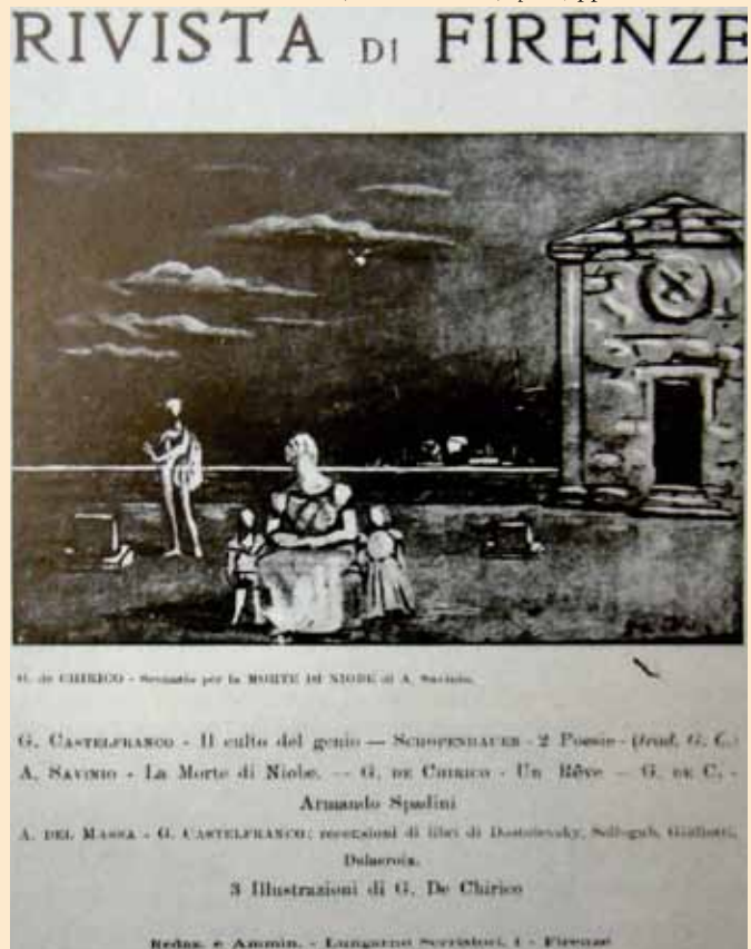
Frontespizio del numero di novembre 1924 della Rivista di Firenze ; si notino i numerosi articoli di Castelfranco, De Chirico e Savinio e in basso la scritta che indica la redazione e la amministrazione della rivista nel villino di Lungarno Serristori.

31 Per i problemi relativi al catalogo della raccolta Castelfranco, vedi Tori 2010, op. cit. , pp 5-6