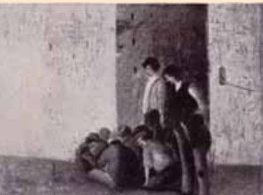
O. Rosai, Giocatori di topa , 1920 c.