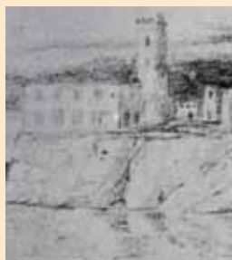
G. De Chirico, particolare di un disegno preparatorio per la Partenza del Cavaliere errante , 1923; la torre e la casa ricordano gli edifici di Piazza Poggi che si vedono dal villino di Castelfranco

La storia di Giorgio Castelfranco come critico, amico, mecenate e collezionista di De Chirico è nota grazie a numerosi studi. Castelfranco conobbe le opere di De Chirico sulla rivista Valori Plastici , quando era un giovane studente di storia dell'arte 3 . Colpito dall'ancora quasi sconosciuto pittore, decise di acquistarne un dipinto 4 . Grazie alla mediazione di Rosai e Soffici 5 , si mise in contatto con l'artista e lo andò a trovare a Milano, città dove allora, ai primi di dicembre del 1919, De Chirico risiedeva. Nei mesi successivi il sodalizio tra i due personaggi si rafforzò fino a diventare una vera amicizia. Nel 1921 De Chirico, che era ancora un artista di scarso successo commerciale, fu ospitato nel villino dei Castelfranco sul Lungarno Serristori 6 . Nella primavera e nell'estate del 1923 l'artista fu nuovamente ospite, per alcuni mesi, in quella che oggi è Casa Siviero ed a maggio vi organizzò una mostra con una ventina di opere 7 . Durante questi soggiorni fiorentini De Chirico completa il percorso che lo porta ad abbandonare temporaneamente la metafisica per recuperare i valori della grande pittura del passato. Egli approfondisce lo studio dei maestri antichi, copiando le opere nei musei e apprendendo le loro tecniche dai restauratori 8 . Il soggiorno di De Chirico nel villino sul Lungarno Serristori era legato ad un accordo per il quale il pittore, a fronte del ricevimento di uno stipendio, cedeva al suo mecenate Castelfranco tutta