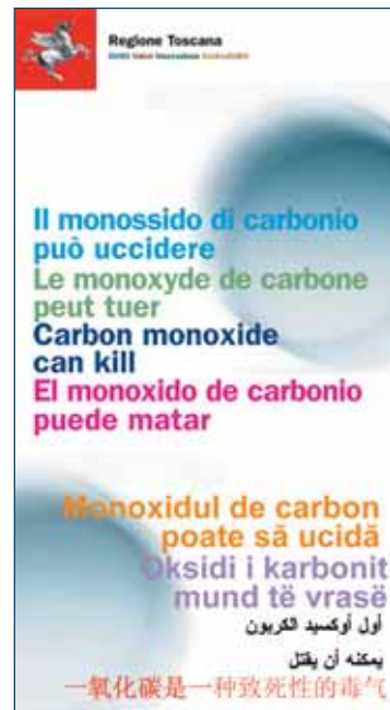
La copertina dell'opuscolo

Sotto accusa motori a scoppio e riscaldamento