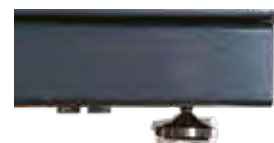
PIEDINI REGOLABILE IN ACCIAIO INOX