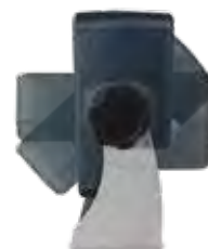
SUPPORTO REGOLABILE IN ACCIAIO INOX