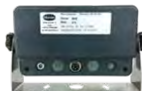
VISTA POSTERIORE (VERSIONE OMOLOGATA)