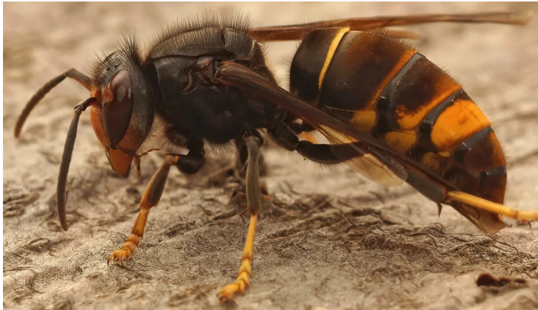
CALABRONE A ZAMPE GIALLE - Vespa velutina

E' inserita nell'elenco delle specie di rilevanza unionale del Regolamento di esecuzione UE 2016/1141 che adotta un elenco delle specie esotiche invasive di rilevanza unionale in applicazione del regolamento (UE) n. 1143/2014 del Parlamento europeo e del Consiglio recante disposizioni volte a prevenire e gestire l'introduzione e la diffusione delle specie esotiche invasive