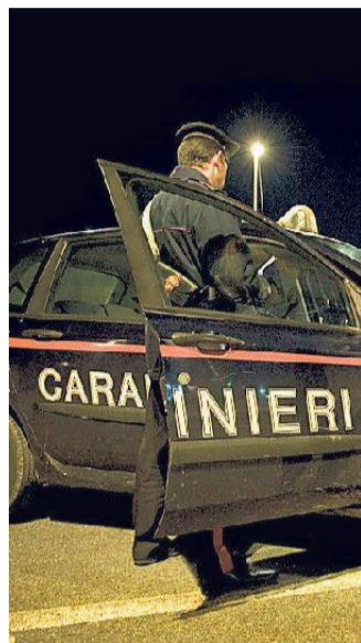
Una pattuglia durante un controllo

Una vicenda su cui ora stanno indagando sia la polizia che i carabinieri del Reparto operativo impegnate a