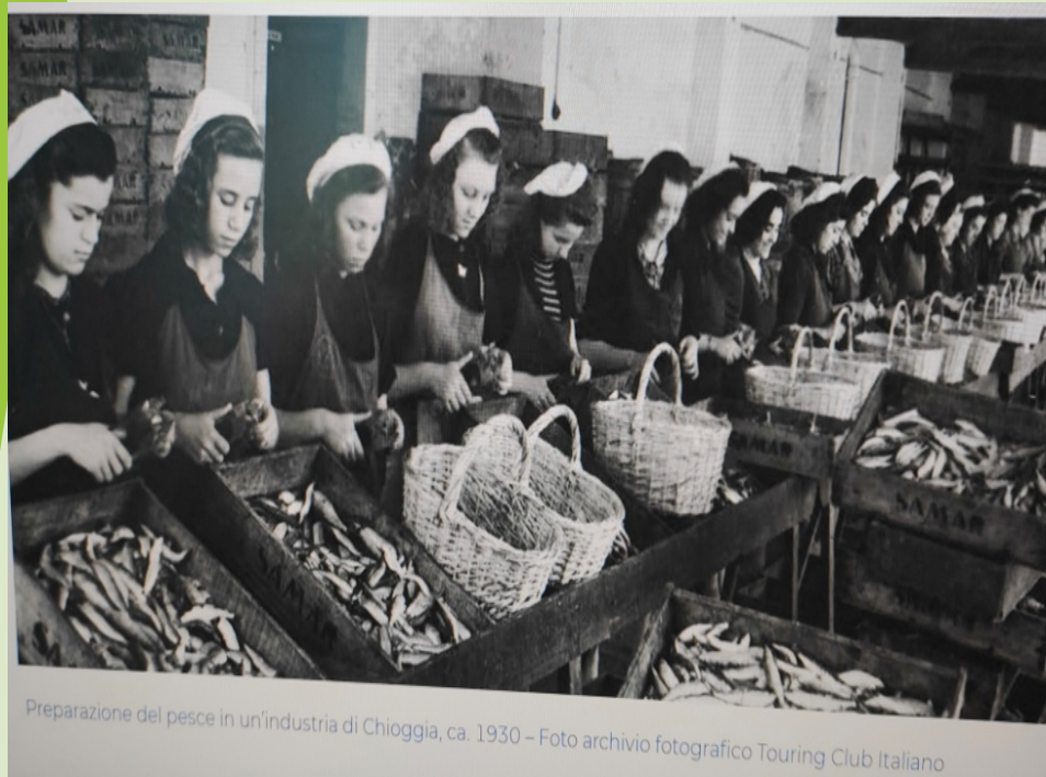
Preparazione del pesce in un'industria di Chioggia, ca. 1930

offrire alle aziende la possibilità di suggerire interventi formativi, finalizzati all'acquisizione di nuove competenze o al rafforzamento di quelle già possedute, affinché le persone inserite nel percorso possano avvicinarsi ai diversi contesti lavorativi