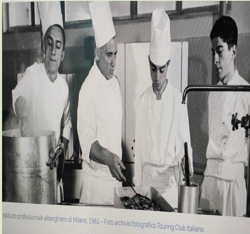
Istituto professionale alberghiero di Milano, 1961

Occorre quindi dare un significato all'accompagnamento al lavoro: