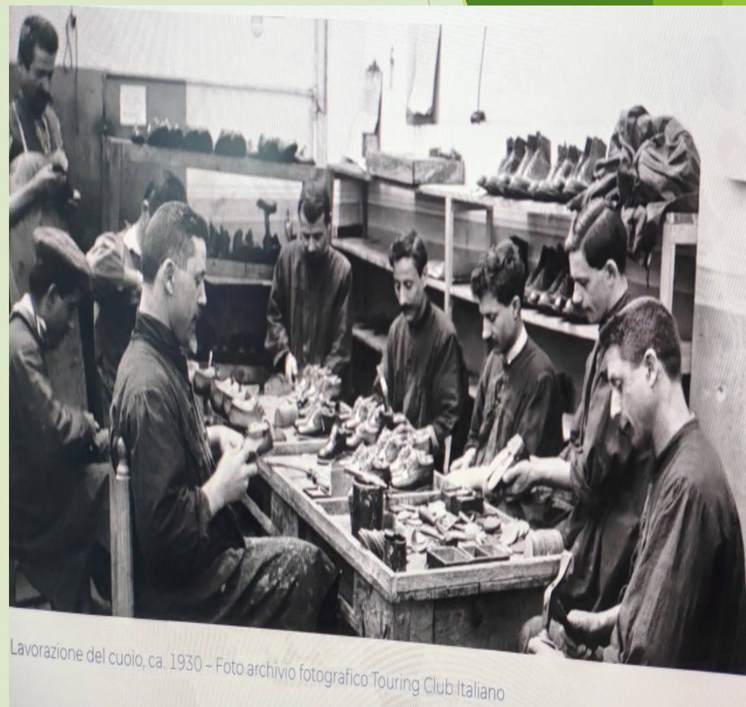
Lavorazione del cuoio, ca. 1930 – Foto archivio fotografico Touring Club Italiano