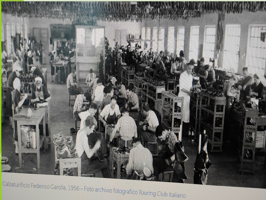
Calzaturificio Federico Garolla, 1956