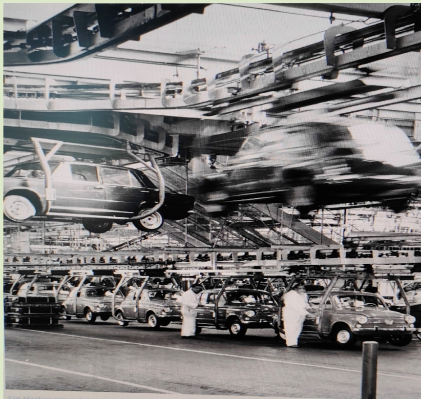
Fiat Mirafiori: convogliatori aerei per il trasporto carrozzerie, ca. 1960

Firenze, Piazza Duomo 10 - Palazzo Strozzi Sacrati, Sala Pegaso