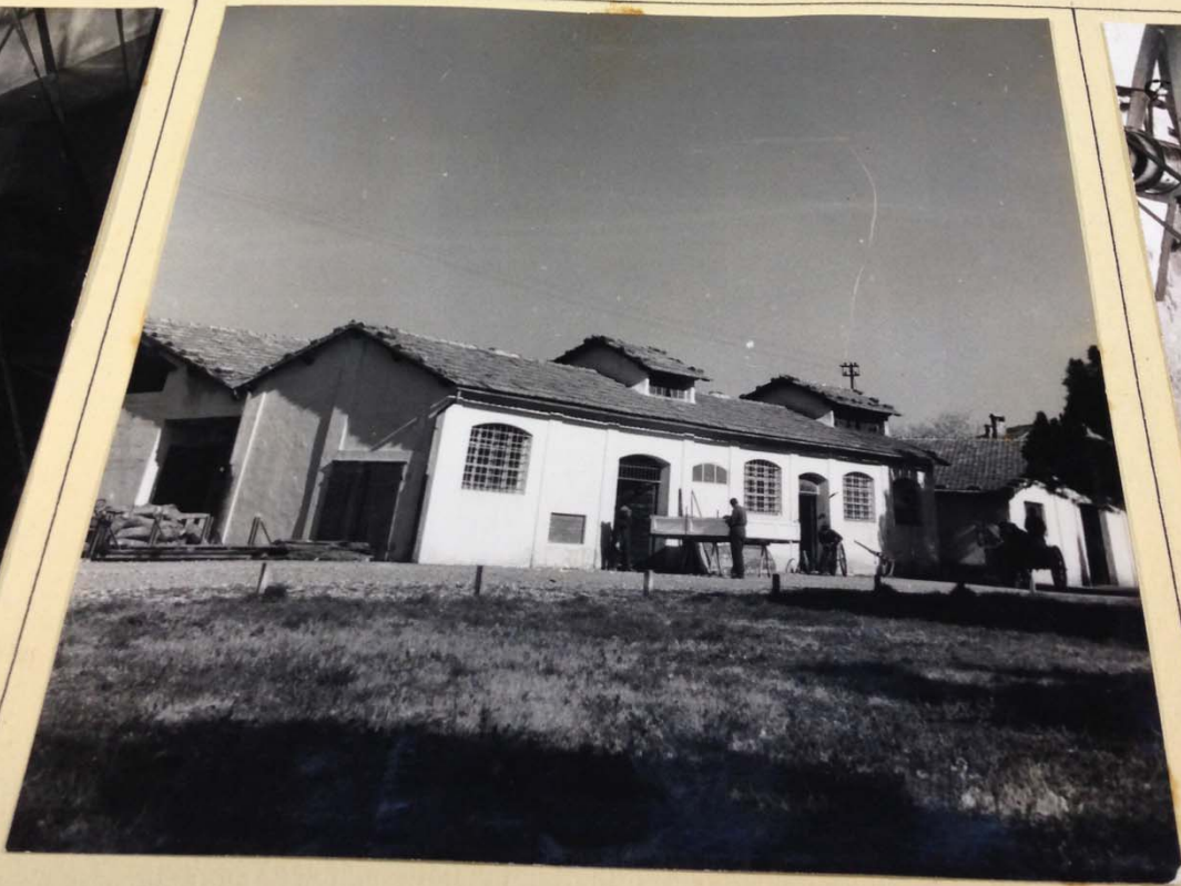
Fabbricati officine Magazzini