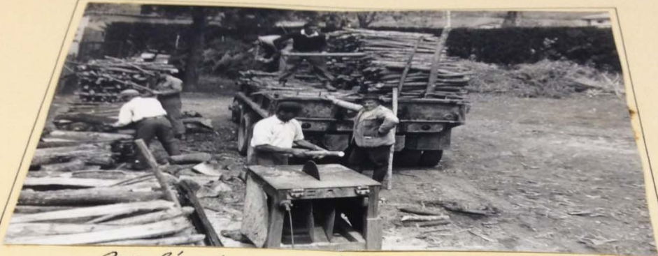
Con l'autocarro si porta la legna da ardere alla sega circolare