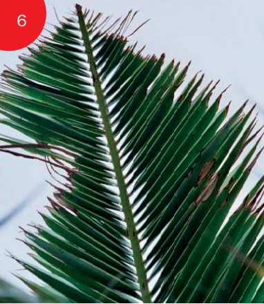
Danni su foglia