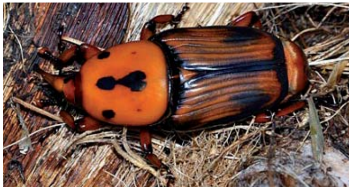
Adulto di Rhynchophorus ferrugineus

In Toscana la prima rilevazione è del 2004 in un vivaio da dove l'insetto è stato immediatamente eliminato. Nel gennaio 2011 è stato ritrovato nei dintorni di Lucca e nell'agosto 2011 a Pietrasanta, da dove poi si è diffuso rapidamente nel resto della Versilia raggiungendo verso Nord, la provincia di Massa Carrara e verso Sud quella di Grosseto e addirittura l'Elba nel 2013. Al momento (febbraio 2015), in Toscana risultano ufficialmente colpiti e distrutti oltre 2000 palme (quasi tutti esemplari di Palma delle Canarie) rinvenuti in 27 Comuni delle province di Lucca, Pisa, Massa Carrara, Grosseto e Livorno.