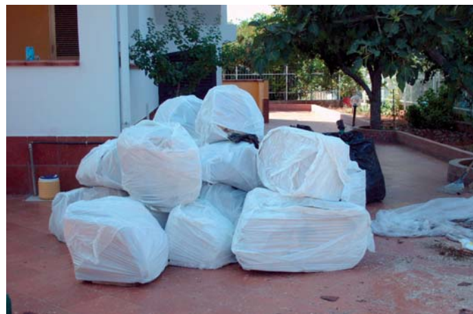
Precauzioni per trasporto dei materiali di risulta

Il materiale di risulta tritato a norma non riveste più interesse dal punto di vista fitosanitario e potrà essere destinato agli eventuali usi consentiti dalla legge.