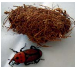
Pupario con adulto