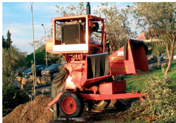
Cippatura dei residui di potatura