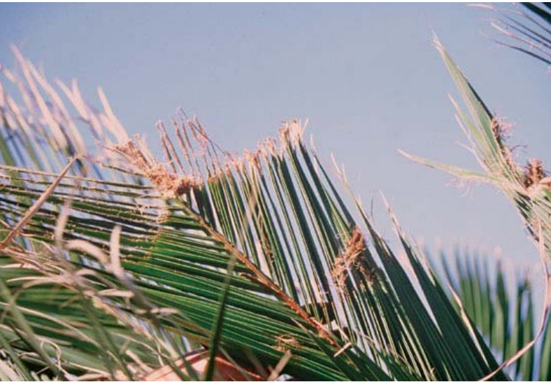
Sintomi su foglia