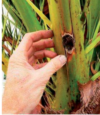
Foro di uscita