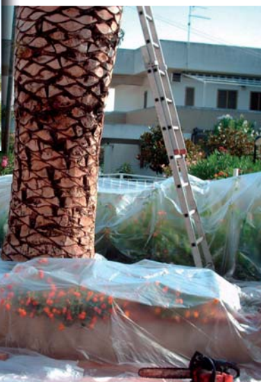
Protezione del terreno durante le operazioni di taglio o di risanamento