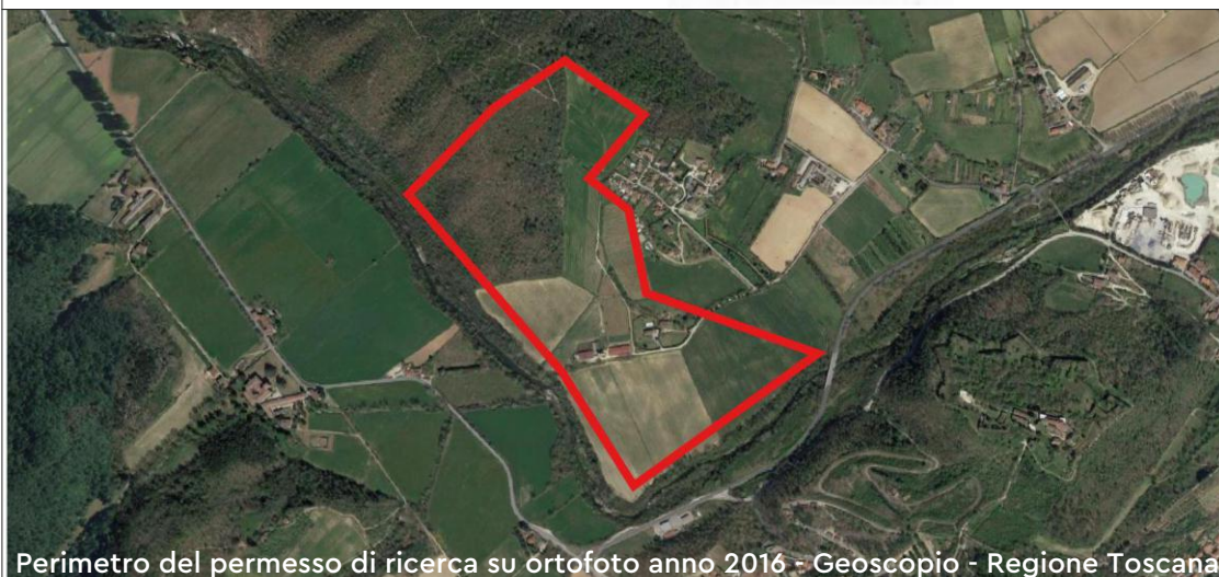
Perimetro del permesso di ricerca su ortofoto anno 2016 - Geoscopio - Regione Toscana

Ordine dei Geologi della Toscana n° 1460