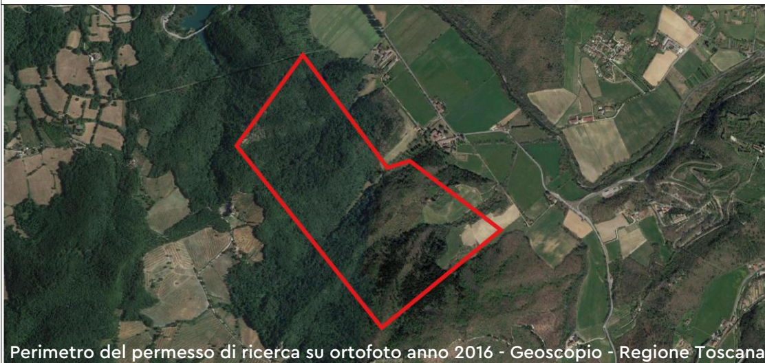
Perimetro del permesso di ricerca su ortofoto anno 2016 - Geoscopio - Regione Toscana

Ordine dei Geologi della Toscana n° 1460