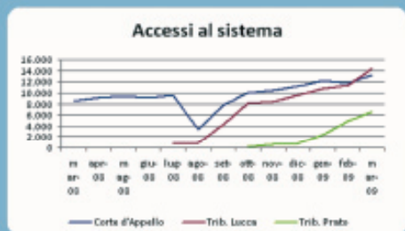
Fig4: Accessi totali al sistema

Nota: Le attivazione dei Tribunali sono differite nel tempo. La corte d'Appello di Firenze è attiva dal 2003. Il Tribunale di Lucca è stato attivato alla fine di giugno 2008 e il Tribunale di Prato a ottobre 2008.