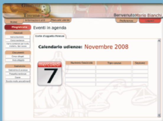
Fig 1: lo schema della home page "Il Magistrato"