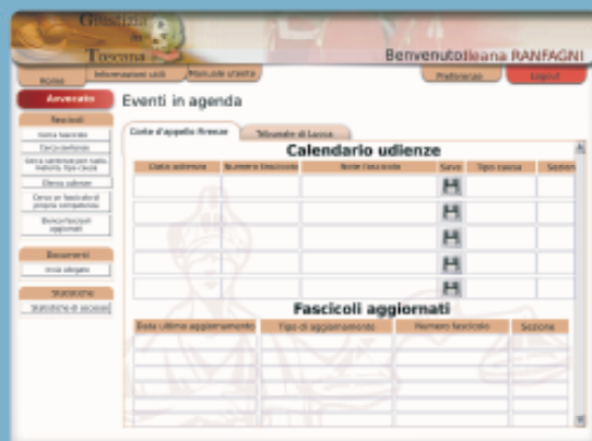
Fig2: lo schema della home page "Avvocato"

Questo dato è evidenziato dal grafico con gli accessi unici giornalieri: ogni accesso unico giornaliero al sistema corrisponde ad un "viaggio" in cancelleria risparmiato. Ad esempio, in media, ogni giorno il 35% degli avvocati di Prato e il 25% degli avvocati di Lucca accede al sistema e non va in Cancelleria.