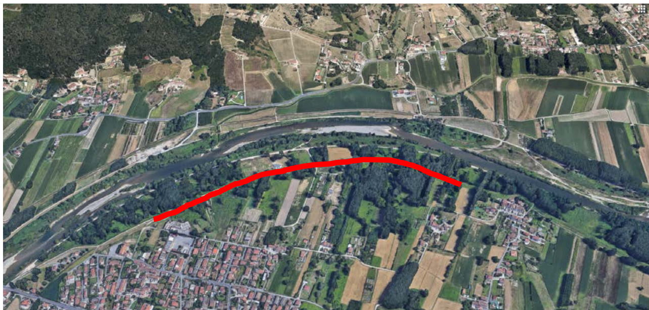
Figura 1 Ubicazione intervento

L'intervento inizia dalla Colonia solare e termina all'altezza di Corte Sandorini