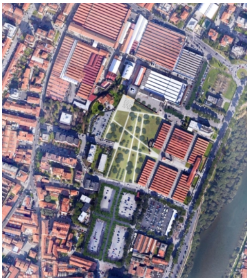
Progetto complessivo dell'area di intervento