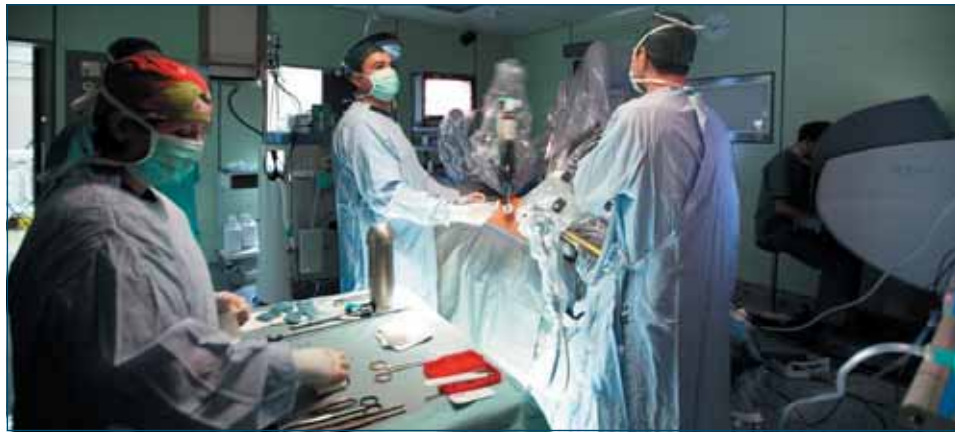
Intervento robotico in sala operatoria a Grosseto