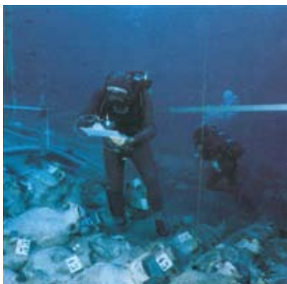
Monte Argentario - Mostra permanente Memorie Sommerse