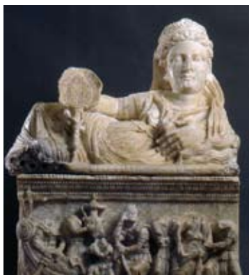
Rosignano Marittimo - Museo Archeologico Nazionale di Castiglioncello