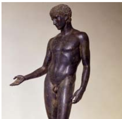
Firenze - Museo Archeologico Nazionale