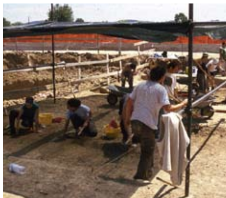
Montelupo Fiorentino - Museo Archeologico e Aree Archeologiche