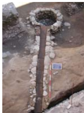
Aulla - Museo dell'Abbazia di San Caprasio