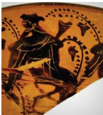
Scansano - Museo Archeologico e della Vite e del Vino di Scansano