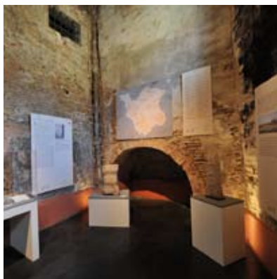
Peccioli - Museo Archeologico