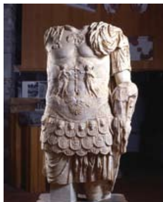
Orbetello - Museo Archeologico Nazionale di Cosa