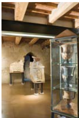
Colle Val d'Elsa - Museo Archeologico "R. Bianchi Bandinelli"