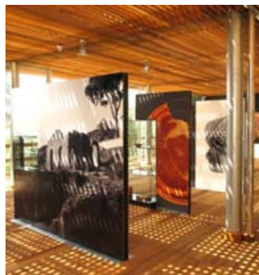
Massarosa - Padiglione Espositivo "Guglielmo Lera" a Massaciuccoli

polazioni barbare, con approfondimenti tematici dedicati alla vita quotidiana, antiche pietanze di Coquina romana, laboratori di archeologia creativa per i più piccoli, percorsi di visita guidata all'area archeologica "Massaciuccoli romana", danze, musiche, giocolerie e spettacoli d'arte varia.