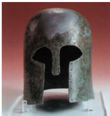
Castiglione della Pescaia - Museo Civico Archeologico "Isidoro Falchi" di Vetulonia