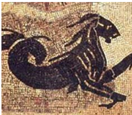
Massarosa - Area Archeologica Massaciuccoli Romana