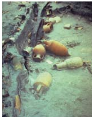
Cantiere delle navi antiche di Pisa