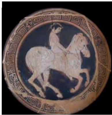
Arezzo - Museo Archeologico Nazionale "Gaio Cilnio Meценate"