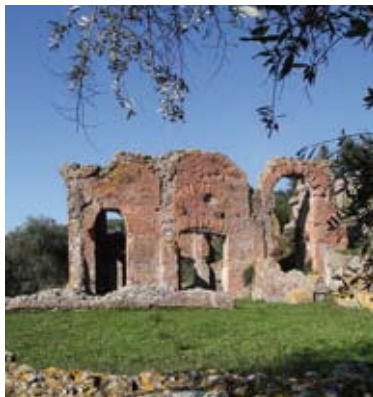
Massarosa - Area Archeologica Massaciucoli Romana