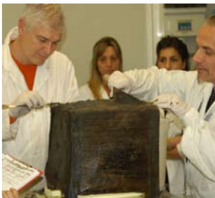
Pisa - Centro di Restauro del Legno Bagnato