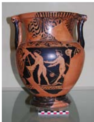
Casole - Museo Civico Archeologico e della Collegiata