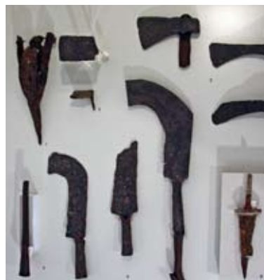
Castelfranco di Sotto - Museo Archeologico di Orentano