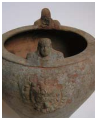
Firenze - Casa Rodolfo Siviero