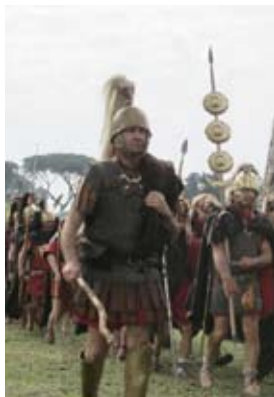
Arezzo - Anfiteatro Romano