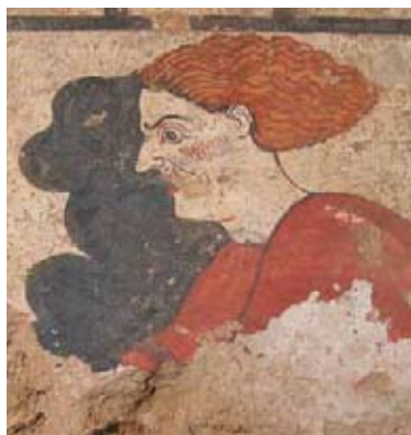
Sarteano - Tomba della Quadriga Infernale