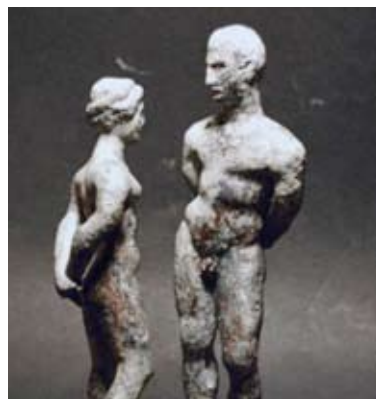
Sorano - Palazzo Pretorio - Centro di Documentazione del Territorio Sovanese