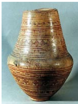
Pitigliano - Museo Civico Archeologico della Civiltà Etrusca