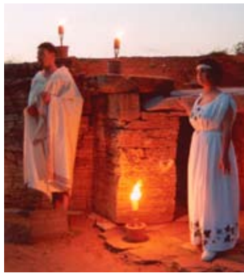
Piombino - Parco Archeologico di Baratti e Populonia