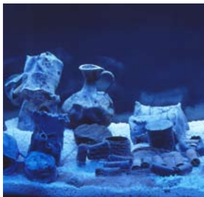
Piombino - Museo Archeologico del Territorio di Populonia

Parzialmente accessibile ai disabili: l'accesso ai disabili è consentito nelle aree museali, a bordo del treno minerario all'interno della Galleria Lanzi-Temperino e nella Miniera del Temperino per alcuni tratti accompagnati da una guida o da un operatore.