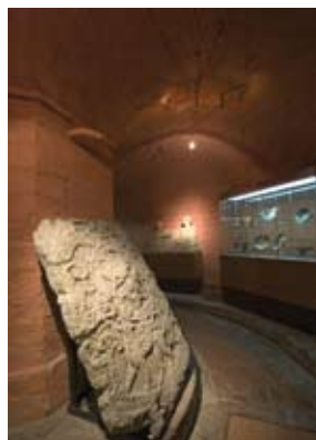
Chianciano Terme - Museo Civico Archeologico delle Acque