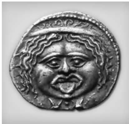
Piombino - Museo Archeologico del Territorio di Populonia