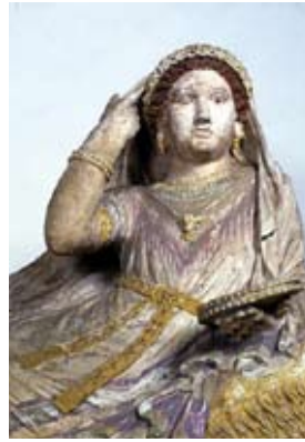
Firenze - Museo Archeologico Nazionale