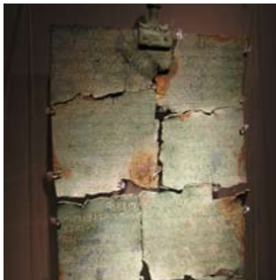
MAEC - Museo dell'Accademia Etrusca e della Città di Cortona