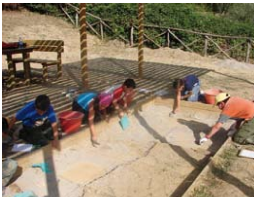
Cetona - Parco Archeologico Naturalistico di Belverde