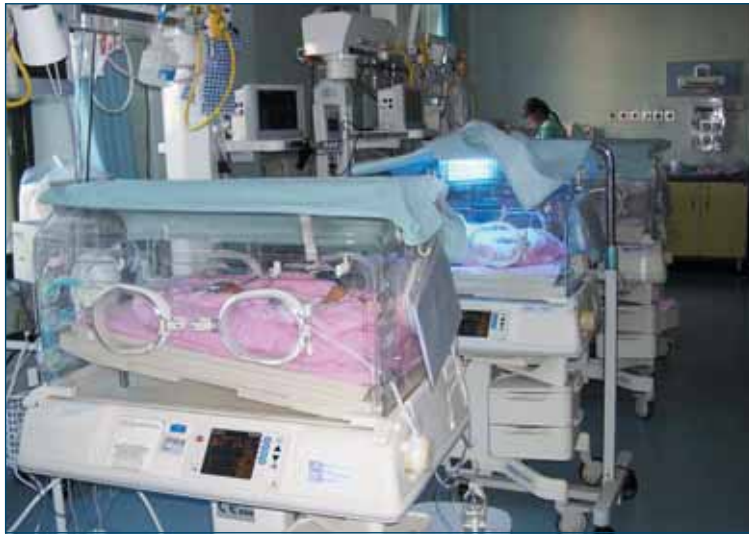
Terapia intensiva neonatale

È di qualche settimana fa la notizia che a Londra una neonata è stata salvata dai medici dell'ospedale di Cambridge, che l'hanno "congelata" per 3 giorni a una temperatura di 33,5° scongiurando danni cerebrali permanenti dovuti alla mancanza di ossigeno alla nascita (ipossia), durata almeno 25 minuti. Si tratta del cosiddetto "baby cooling" ed è ormai considerata universalmente la terapia standard per i neonati che soffrono di encefalopatia ipossico-ischemica come esito di un parto difficile. Negli Usa e nel Nord Europa viene regolarmente praticata, in Italia solo in alcuni centri poiché è richiesta la massima integrazione fra punto nascita, trasporto neonatale e terapia intensiva neonatale, in quanto spesso si tratta di una vera e propria lotta contro il tempo (affinché sia efficace, infatti, il trattamento ipotermico deve cominciare entro le 6 ore dal parto).