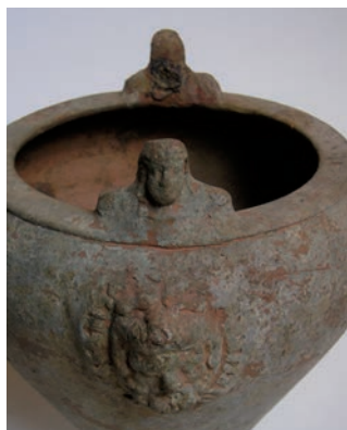
Firenze - Casa Rodolfo Siviero