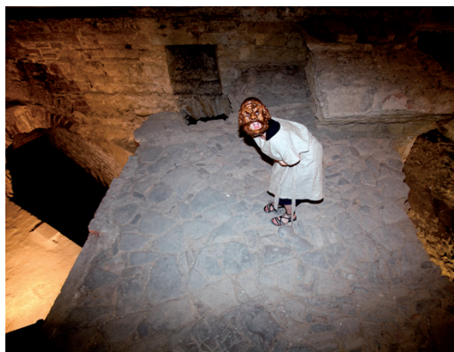
Firenze - Scavi Archeologici di Palazzo Vecchio