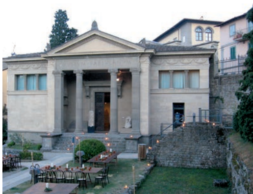
Fiesole - Museo Civico Archeologico