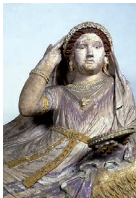
Firenze - Museo Archeologico Nazionale

Compagnia delle Seggiole”, si tratta di un dialogo teatrale tra Rodolfo Siviero e una studentessa di archeologia sul tema del trafugamento di opere del patrimonio archeologico italiano da parte dei nazisti e del successivo recupero da parte di Rodolfo Siviero. Durata: 1 ora (tre repliche con inizio alle ore 20.30, 21.30, 22.30) Ingresso: gratuito (prenotazione obbligatoria) tel. 333 2284784 Accessibile ai disabili