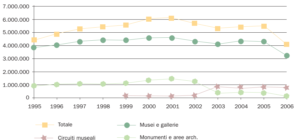
► Visitatori paganti degli Istituti statali di antichità e d'arte per tipologia. Anni 1995-2006 (a) Fonte: elaborazione su Ministero per i Beni e le Attività Culturali

(a) Dal 2003 il Giardino di Boboli ha accesso solo con un circuito museale, dunque i visitatori sono registrati qui e non più come monumento