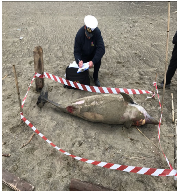
Attività delle Capitanerie di Porto a seguito di spiaggiamenti