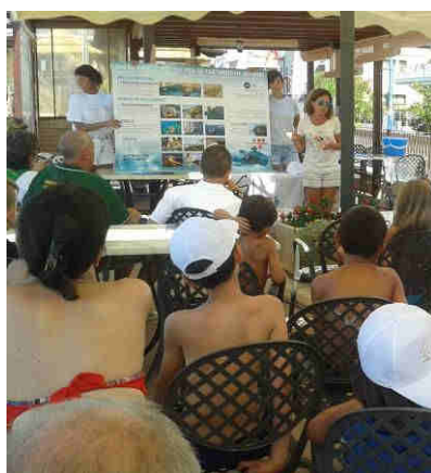
Didattica in spiaggia in collaborazione con l'Associazione TartAmare

Così ad esempio l'informazione ai diportisti sarà orientata sulla necessità di preservazione dell'ambiente pelagico e sulle tecniche di avvicinamento dei cetacei in caso di avvistamento e/o collisione; per i bambini ed i ragazzi delle scuole sono utili i corsi didattici per la conoscenza dell' ambiente marino e l'apprendimento delle buone pratiche per la riduzione dell'abbandono dei rifiuti da porre in essere sia sulla spiaggia che nelle attività consuete; per i ragazzi delle scuole superiori è possibile attivare percorsi scuola – lavoro; per gli adulti e turisti sono apprezzate le iniziative di sensibilizzazione alla riduzione dei piccoli rifiuti e mozziconi di sigaretta durante le attività dinamiche svolte sulla spiaggia e le attività di whale watching .