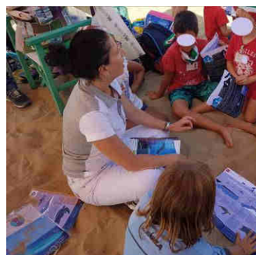
Iniziativa con le brochure dell'Osservatorio Toscano per la Biodiversità

A ciò si aggiunge lo sviluppo e l'utilizzo dei media per la diffusione e promozione delle iniziative. Questo è il passaggio finale che conclude il percorso programmatico,