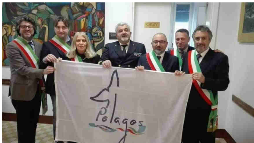
Consegna della bandiera ai Comuni aderenti durante la Cerimonia di Sottoscrizione della Carta di Partenariato

Attualmente sono 105 i Comuni che hanno sottoscritto l'impegno di cui alla Carta di Partenariato (su 111 nazionali - pari al 95 % degli aventi diritto); le regioni Liguria e Sardegna hanno completato le adesioni; in Toscana sono 29 su 35 i comuni costieri che hanno aderito al progetto.