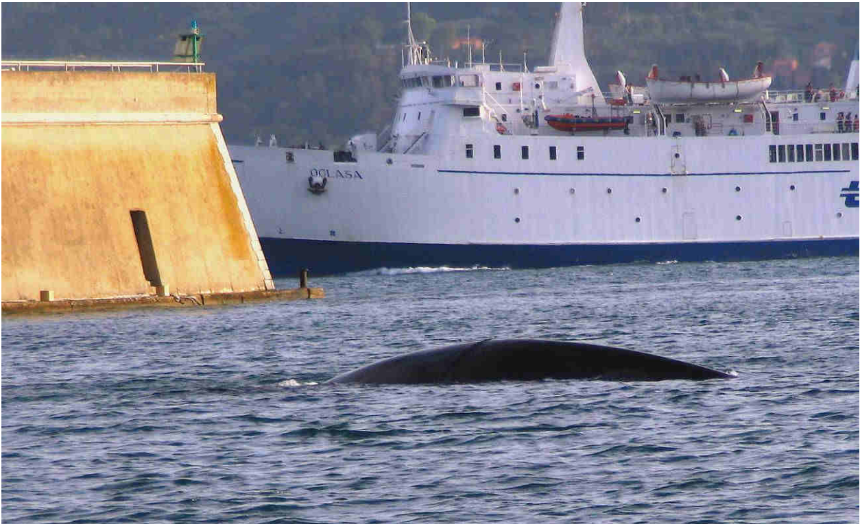
Avvistamenti nell'Arcipelago Toscano